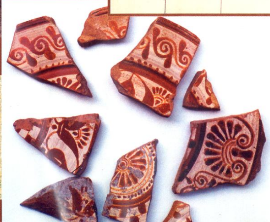
Обломки восточноевропейской тарелки