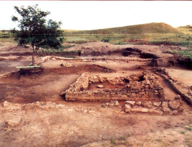
храм Афродити. VI в. до н.е.

Видавництво «Стилос», 04070, Київ-70, Контрактова пл., 7 Свідчення Держкомінформу України (серія ДК № 149 від 16.08.2000 р.) Підл. до друку 01.07.2002. Наклад 1000 прим.