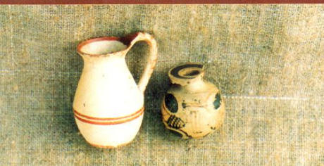
Хиосский и коринфский сосуды