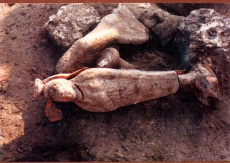
Терракотовые фигурки на полу храма